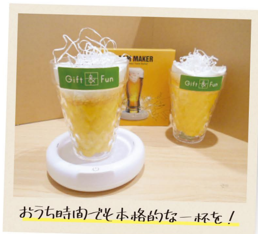
おうち時間でも本格的な一杯を！