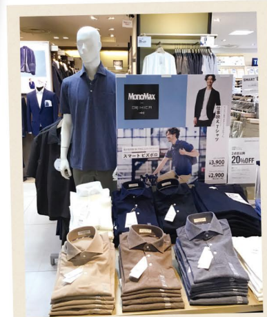
オフィスでも快適に！