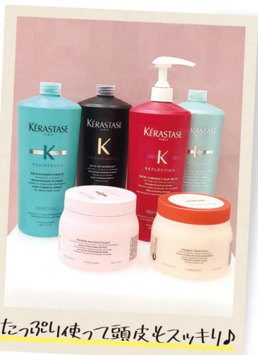
たっぷり使って頭皮もスツキリ♪