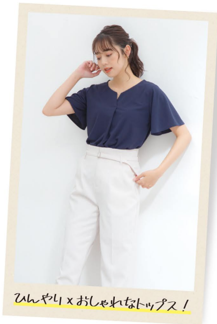
ひんやり×おしゃれなトップス！

暑い夏でも快適に着用頂けるCOOL機能素材モデルが登場しました。素材には優れた清涼性と速乾性を実現する、サステナビリティに配慮した通気性に優れた繊維を採用。一般的なジーンズよりも薄手で、軽量かつ穿きやすい素材です。